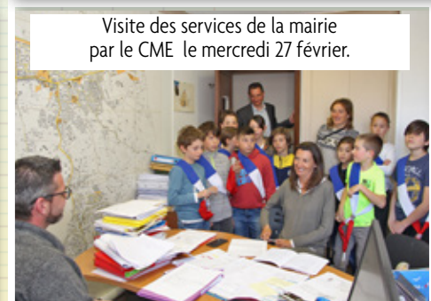
Visite des services de la mairie par le CME le mercredi 27 février.