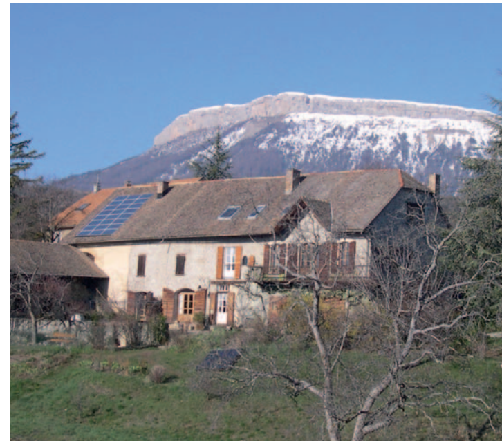
Installation solaire photovoltaïque