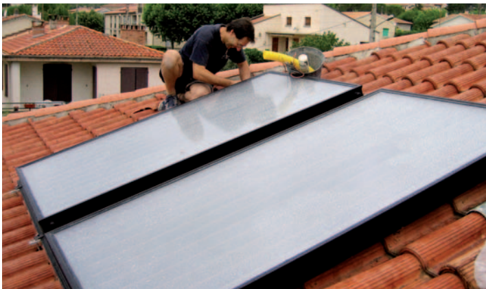
Installation solaire thermique