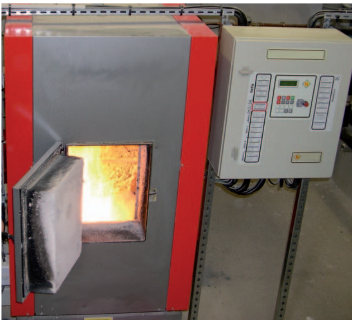
Chaudière à bois déchiqueté